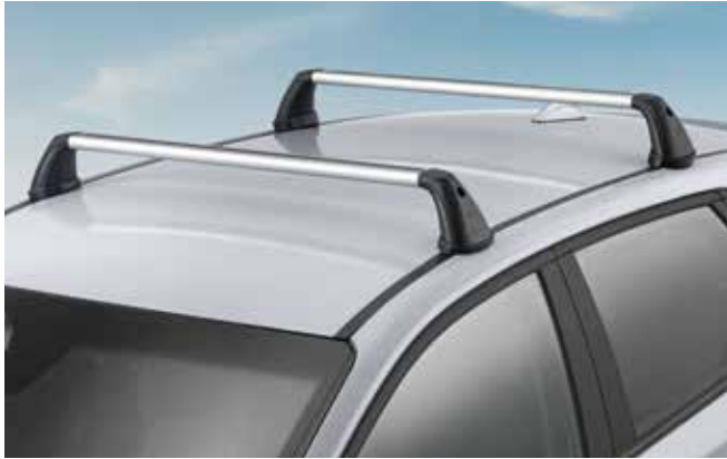
1) Grundträger, Aluminium