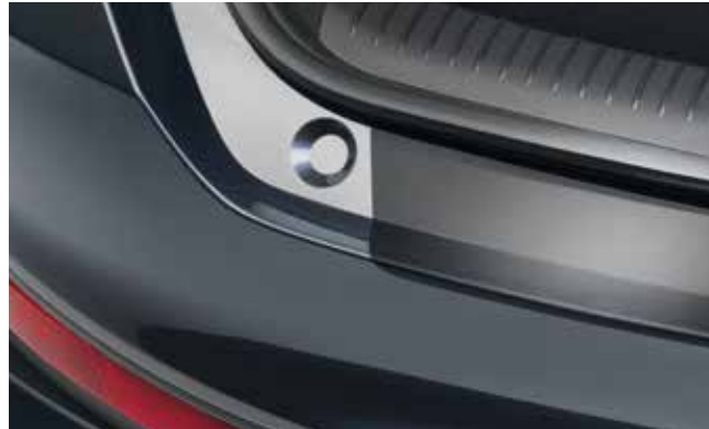
3) Ladekantenschutzfolie, Schwarz (Fastback)