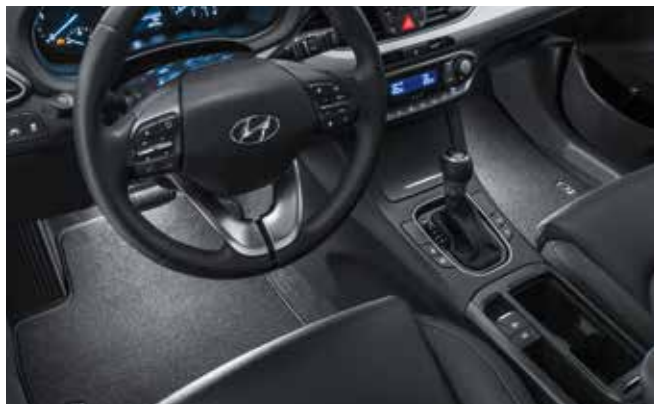
1) LED-Fußraumbeleuchtung, Weiß, 1. Reihe

Fühlen Sie sich nie wieder hilflos wenn Sie versuchen, einen bestimmten Gegenstand im Dunkeln in Ihrem Kofferraum zu finden. Die LED Kofferraum- und Heckklappenbeleuchtung schaltet sich ein, sobald Sie die Heckklappe öffnen. Genießen Sie die helle Ausleuchtung in und außerhalb Ihres Kofferraums. 99652ADE00