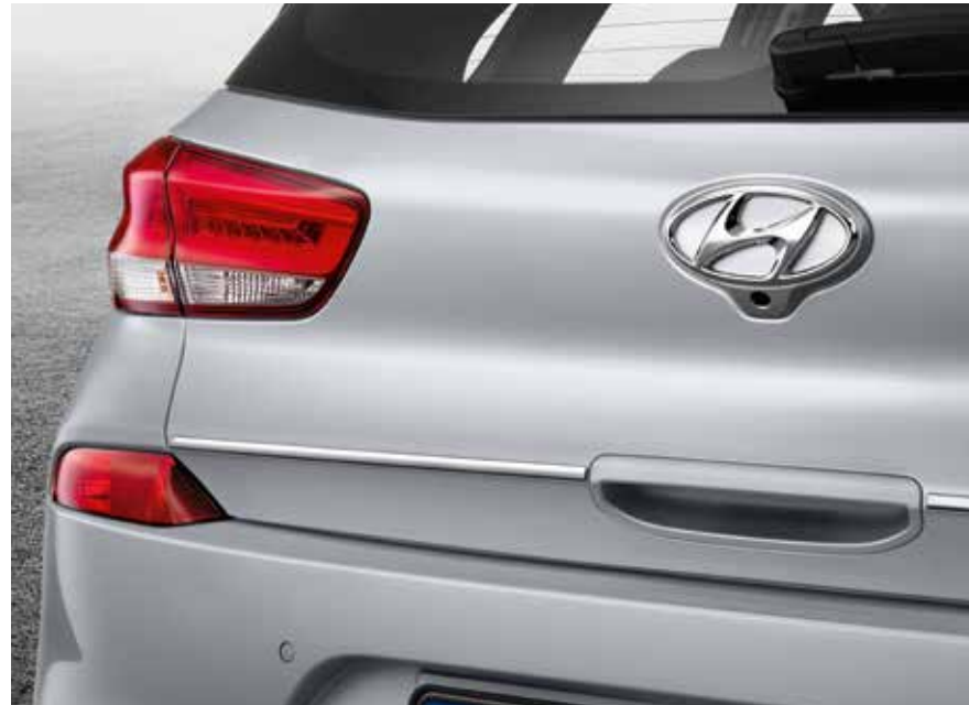
2) Heckklappenzierleiste (5-Türer)