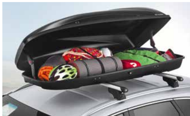
5) Dachbox 390