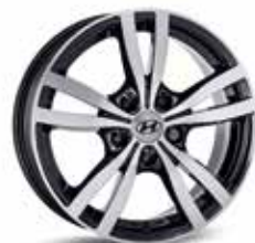
5. Leichtmetallfelge 16" Asan