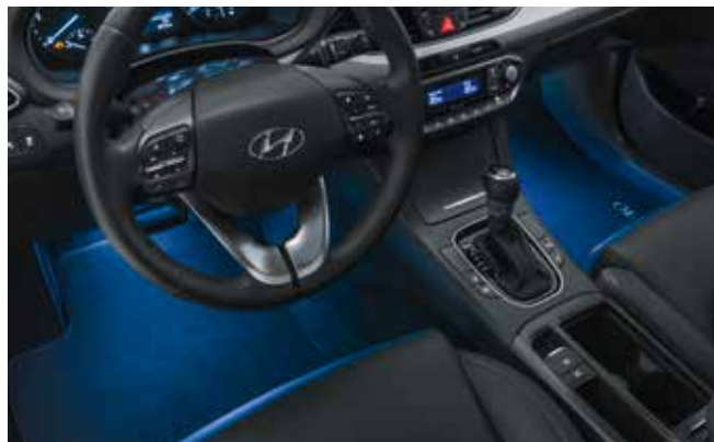
2) LED-Fußraumbeleuchtung, Blau, 1. Reihe