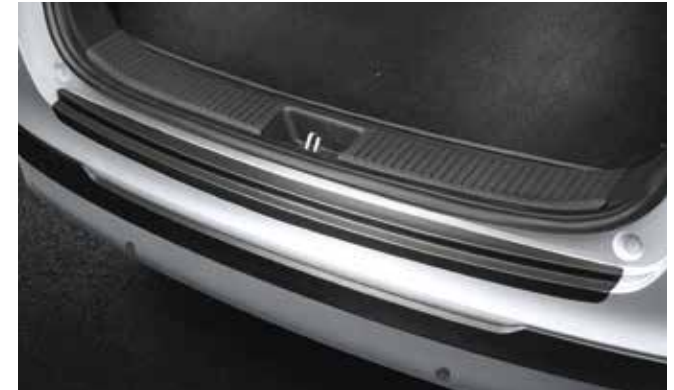
4) Ladekantenschutzfolie, Schwarz (Kombi)