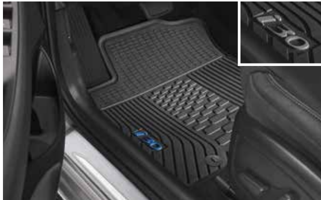
1) Gummimatten-Satz, mit Farbakzent

Freuen Sie sich auf eine lange Zeit mit Ihrem neuen i30. Schützen Sie Ihren Hyundai ab dem 1. Tag vor Schmutz, Feuchtigkeit und Kratzern mit maßgeschneidertem Zubehör, das perfekt ins Interieur passt.