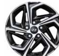
7. Leichtmetallfelge 16"