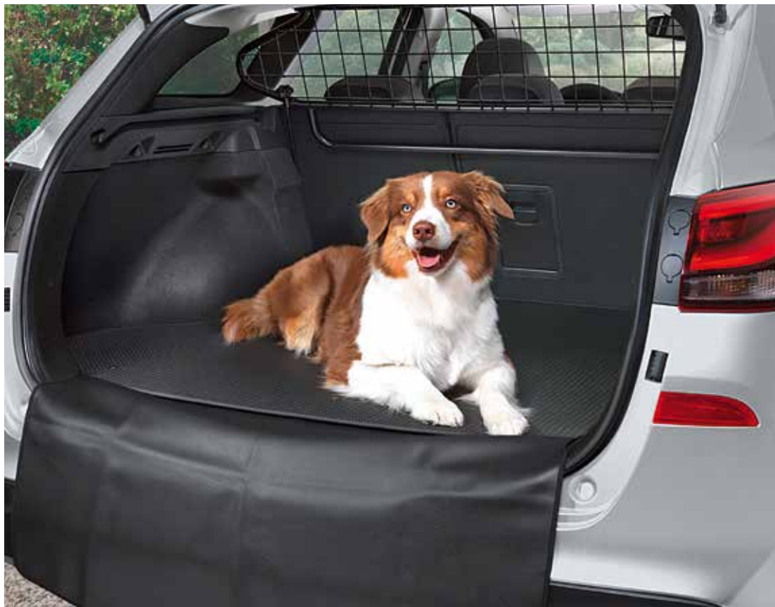
1) Trenngitter, Oberteil