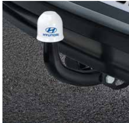
4) Anhängervorrichtung, starr