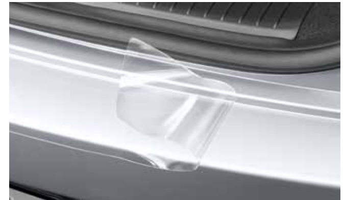
6) Ladekantenschutzfolie, Transparent