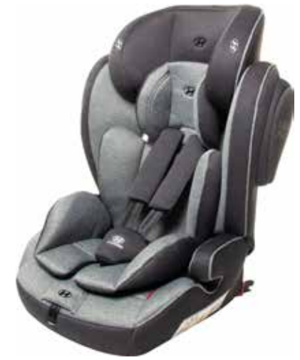
7) Kindersitz Premium Isofix, 99760ADD03