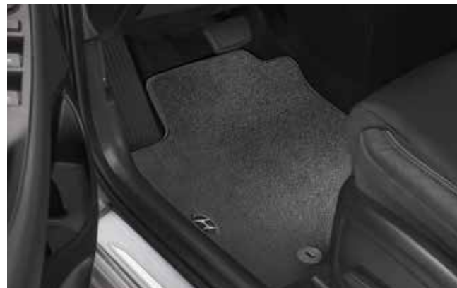
4) Textilmatten-Satz, Premium