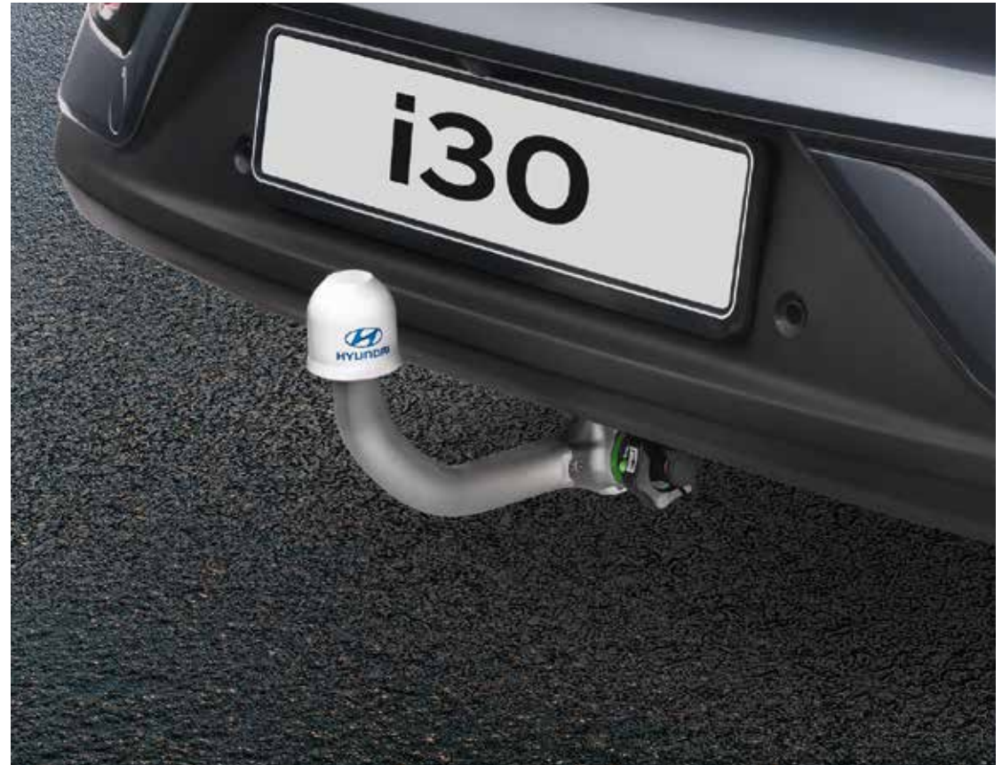
6) Anhängervorrichtung, abnehmbar