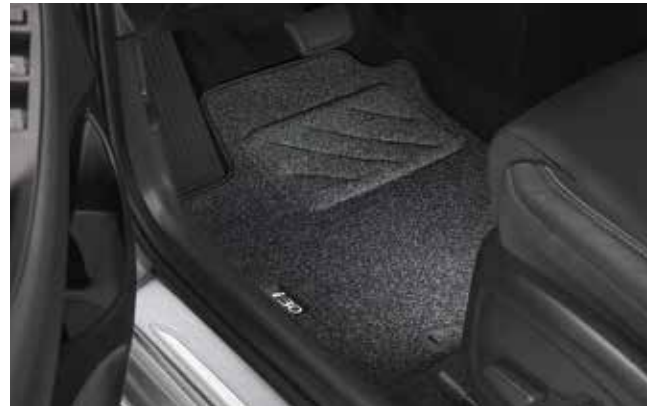
2) Textilmatten-Satz, Nadelfilz