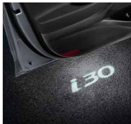
4) LED Türprojektion, i30 Logo