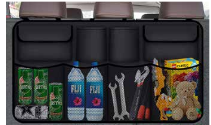
4) Kofferraumorganizer für die Kopfstütze

Der Organizer bietet praktische Taschen und Staufächer, damit Gegenstände nicht lose im Kofferraum liegen. 99760ADD04