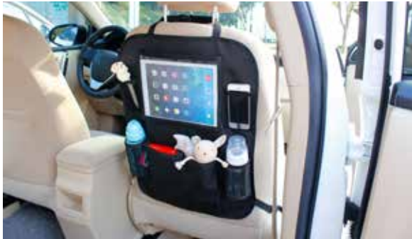
1) Organizer für Rückenlehne