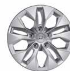
12. Radzierblende 15"