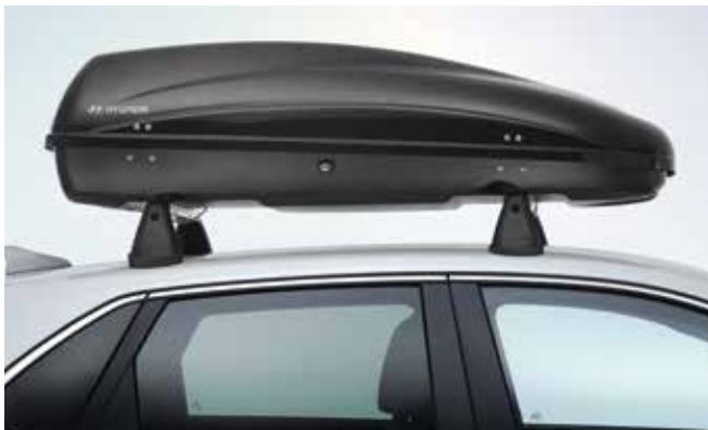
4) Dachbox 330