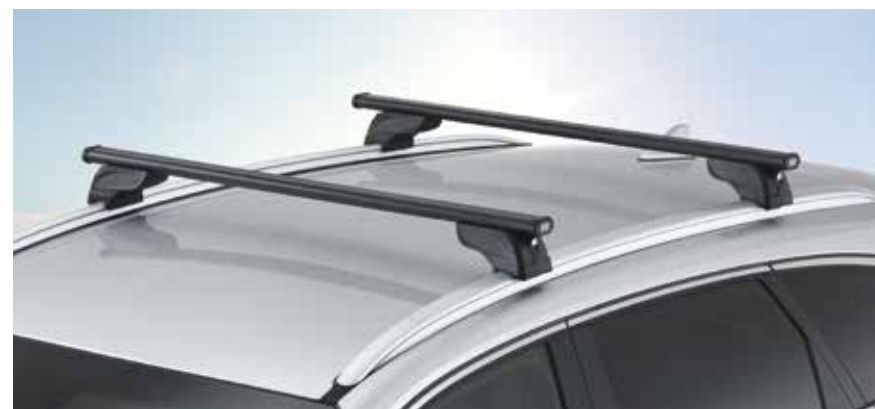
3) Querträger, Stahl