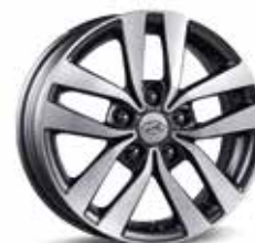
6. Leichtmetallfelge 16"