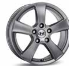
3. Leichtmetallfelge 15" Mabuk 4. Leichtmetallfelge 16" Mabuk