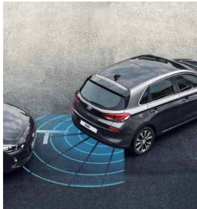
6) Einparkhilfe, hinten