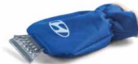
Eiskratzer mit Handschuh