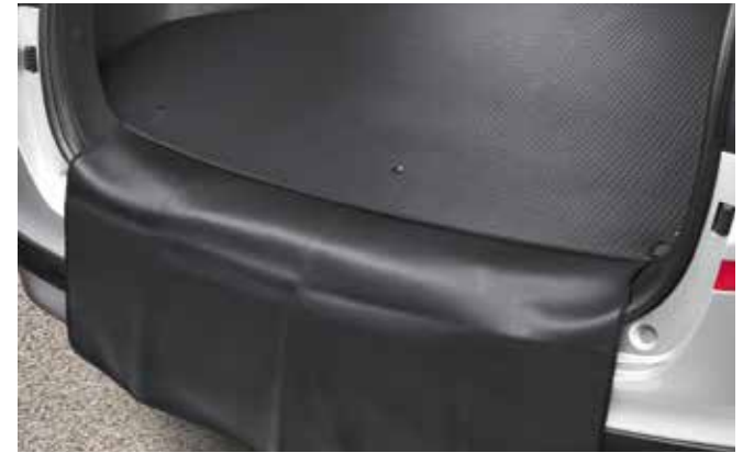
4) Ladekantenschutz für Kofferraummatte, zum Wenden (Kombi)