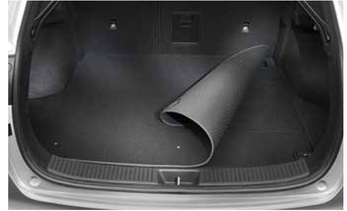
3) Kofferraummatte, zum Wenden (Kombi)