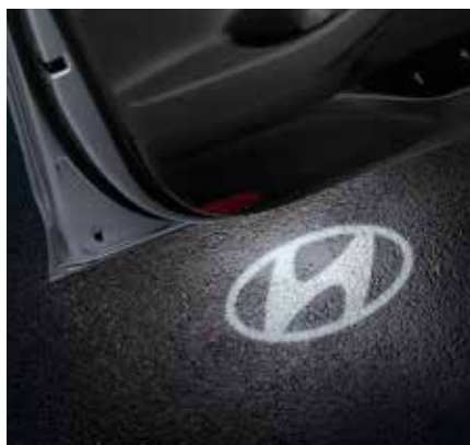
3) LED Türprojektion, Hyundai Logo

Diese LED-Türprojektion wird jedes Mal aktiviert, wenn die Türen Ihres i30 vorne geöffnet werden und projiziert ein i30 Logo auf den Boden. G4651ADE00