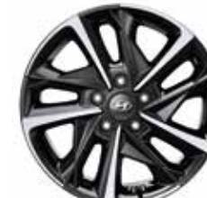
10. Leichtmetallfelge 17"