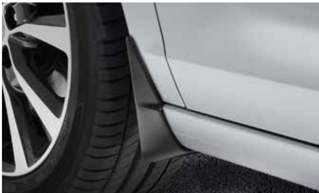
7) Schmutzfänger, vorne