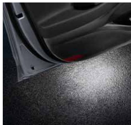
5) LED Türbeleuchtung