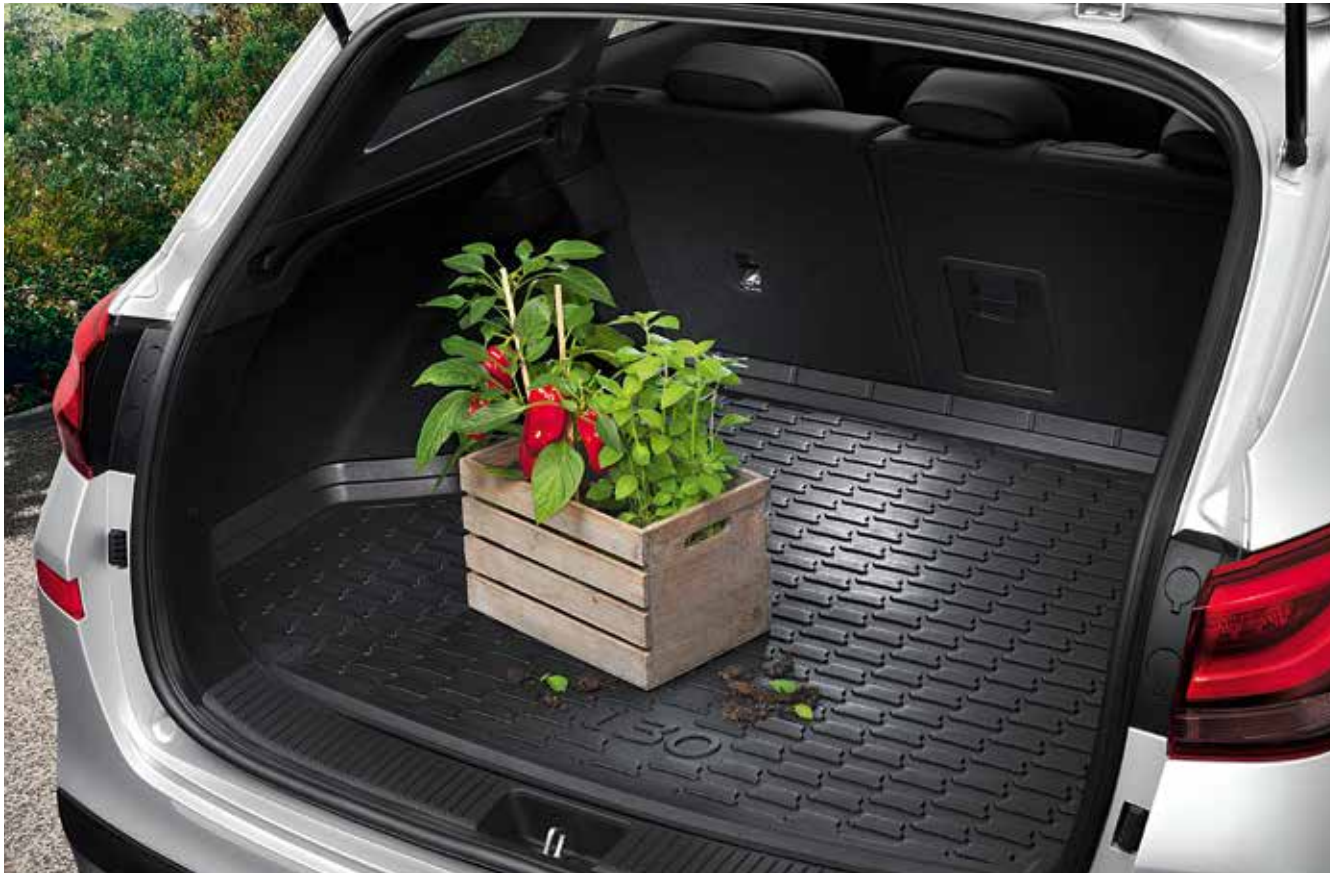
5) Laderaumwanne (Kombi)