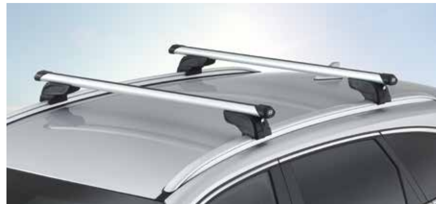
2) Querträger, Aluminium

Das Gitter trennt die hintere Sitzreihe vom Kofferraum. G4150ADE10 (Kombi)