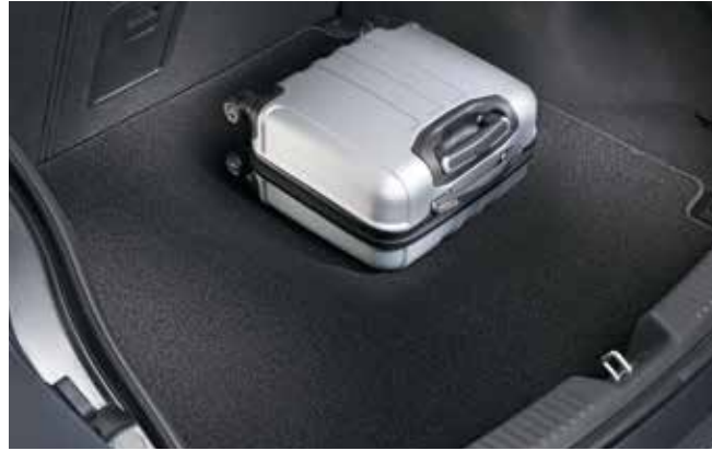
2) Kofferraummatte, zum Wenden (Fastback)