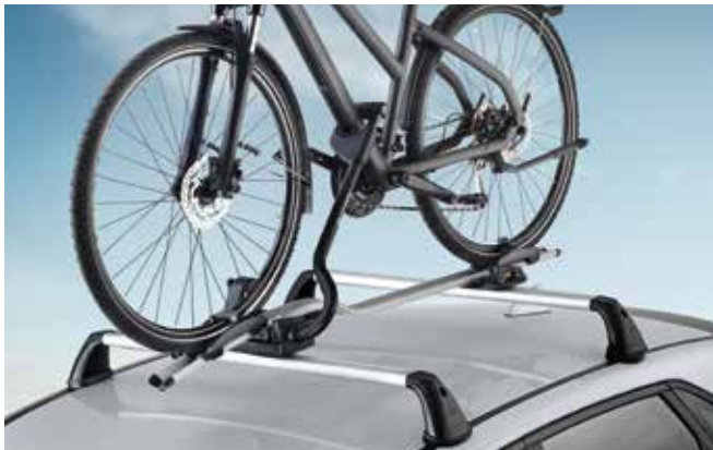
5) Fahrradträgeraufsatz Pro

5) Fahrradträgeraufsatz Pro Reduzieren Sie den Aufwand für das Be- und Entladen bei Ihrer nächsten Fahrradtour mit diesem Premium-Träger. Stellen Sie Ihr Fahrrad einfach auf den Rahmenträger und Sie können es mit einem Handgriff auf Dachhöhe mit den praktischen Drehknöpfen einstellen und sichern. Max. Beladung bis zu 20 kg. Abschließbar für zusätzliche Sicherheit.