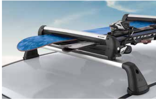
4) Ski- &amp; Snowboardträgeraufsatz 600