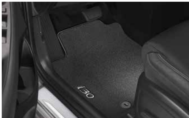
3) Textilmatten-Satz, Velours