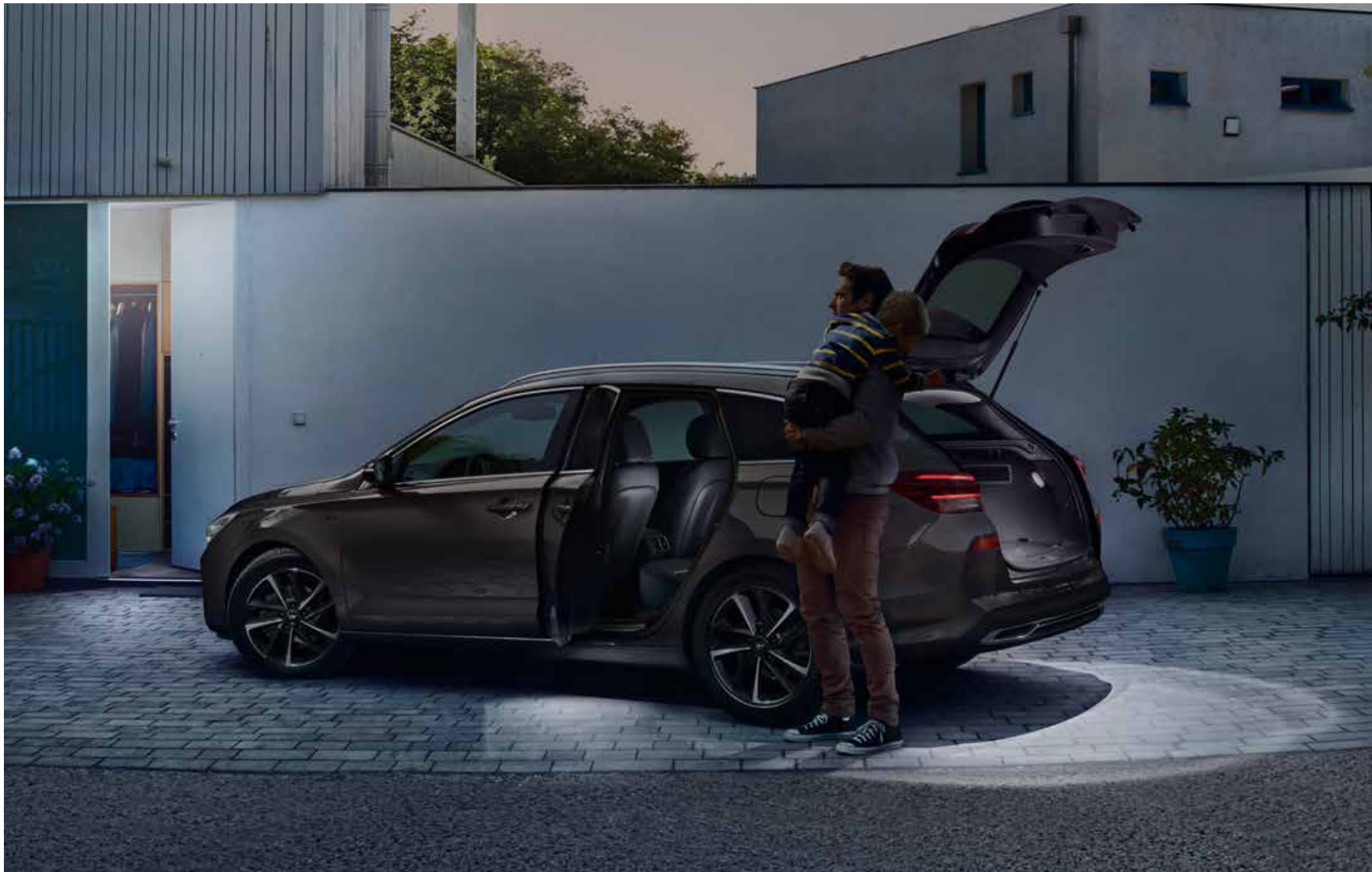
6) LED Türbeleuchtung & 7) LED Kofferraum- und Heckklappenbeleuchtung