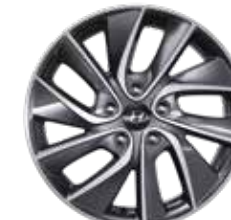
9. Leichtmetallfelge 17"