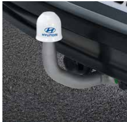
5) Anhängervorrichtung, abnehmbar