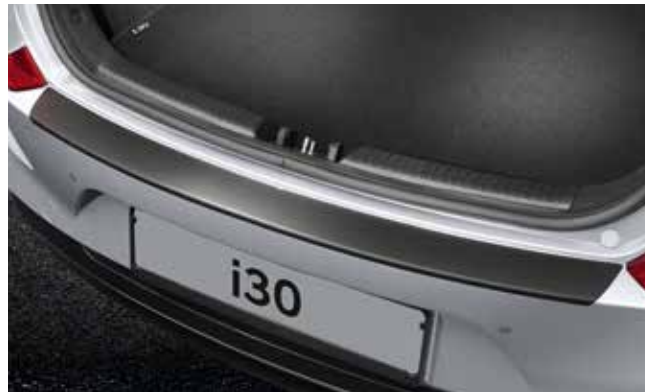
5) Ladekantenschutzfolie, Schwarz (5-Türer)