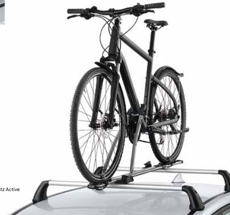
6) Fahrradträgeraufsatz Active