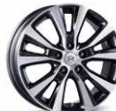
8. Leichtmetallfelge 17"