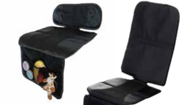
4) Schutzunterlage Standard