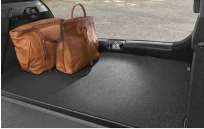
1) Kofferraummatte (5-Türer)