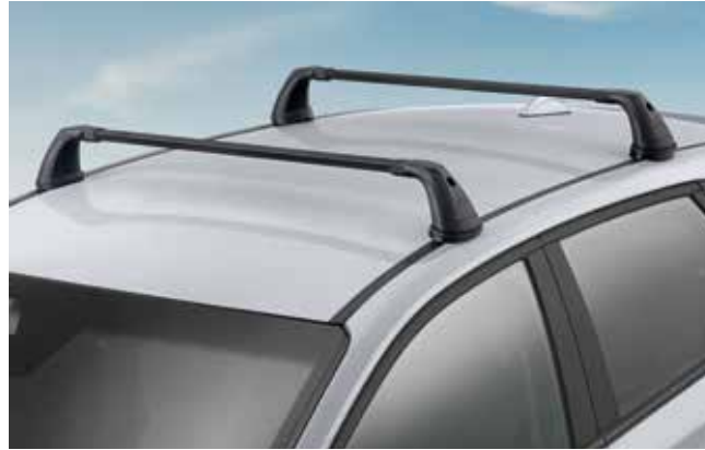
2) Grundträger, Stahl