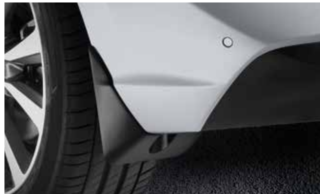
8) Schmutzfänger, hinten