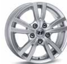
2. Leichtmetallfelge 15" Asan