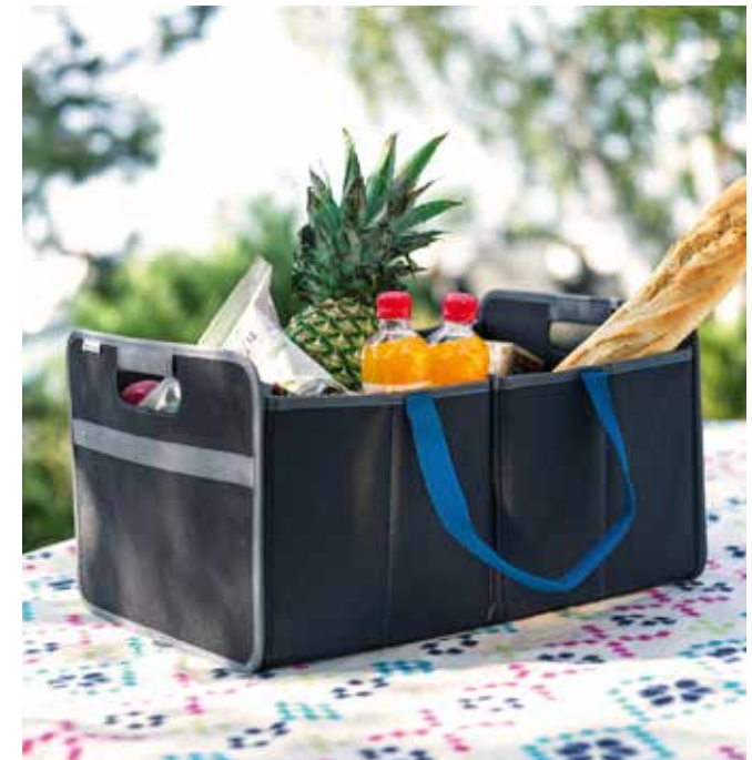
7) Kofferraumorganizer, faltbar

99603ADE00 (5-Türer, Kombi / hinten/ Angle-Adapter erforderlich für Kombi: 99603ADE99)