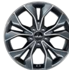
11. Leichtmetallfelge 18"