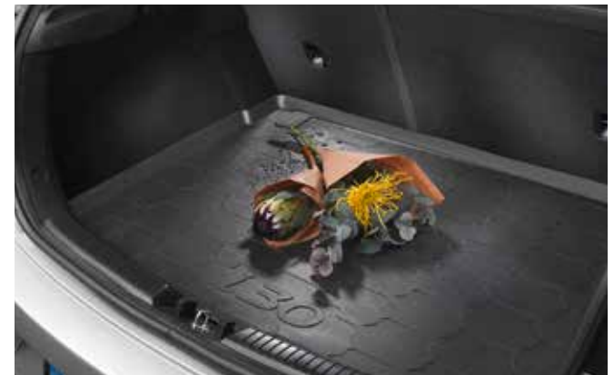
6) Laderaumwanne (5-Türer)