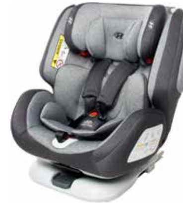
6) Kindersitz 360° Reboarder, 99760ADD02