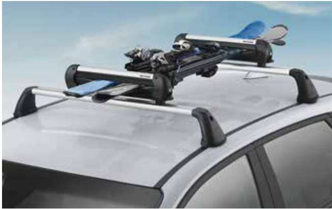
3) Ski- &amp; Snowboardträgeraufsatz 400