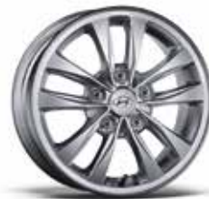
1. Leichtmetallfelge 15"